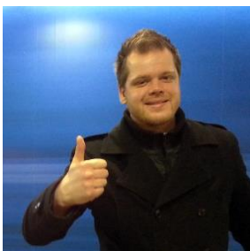
Wouter Tas Vakbond: geen

"OR zaken en zaken aangaande het vertegenwoordigen hebben altijd al mijn interesse, ik heb al eerder in een OR gezeten. Familie, vrienden en kennissen en alle anderen die mij een beetje kennen weten van mijn ambitie om president van mijn land te worden. Vertegenwoordiging zit van kleins af aan in het bloed. Daar is dit weer een opstap naar. Het dienen van mijn achterban, maar ook het sparren met de ondernemer (lees: parlement) zijn zeker zaken die mij na aan het hart liggen. Randstad is daarnaast ook een wereldwijde speler, wat goed is voor mijn leerproces in het omgaan met belangen die soms ook grensoverschrijdend zijn. Mocht mijn motivatie als lame / lauw overkomen wil ik graag bij deze opmerken dat dit zeer zeker niet de bedoeling is, en dan is 'zeer zeker niet' een hele grote UNDERSTATEMENT. Weg met haterz stem op mij en ik ga knallen vo je in die OR. Je weet zelf toch.."